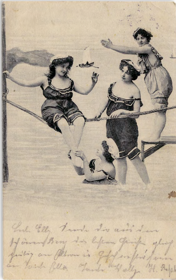
oben links Neckische Nixen: Vier Damen mit raffi- nierten Kopfbedeckun- gen und legerer Bade- kleidung frönen ihrer Bade-Lust auf dieser Ansichtskarte, die 1903