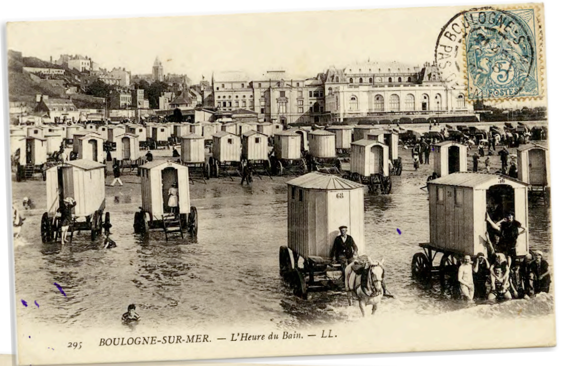
29; BOULOGNE-SUR-MER. — L'Heure du Bain. — LL.