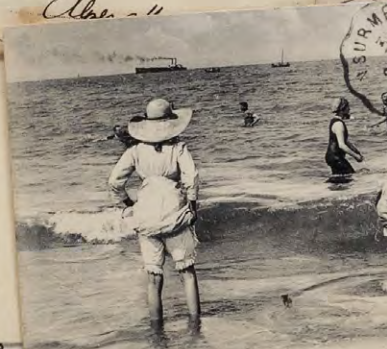
5020. Aux Bains. - LL