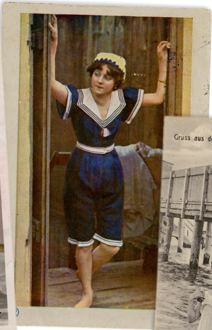
links Matrosen-Look: Kess und in Farbe zeigt sich dieses Bademodell von 1913 in einem ein- teiligen Badekostüm, dessen Beinkleid bis zum Knie reicht.

Ein passender Gürtel, ein großer Kragen und eine Kopfhaube runden das Erschei- nungsbild ab.